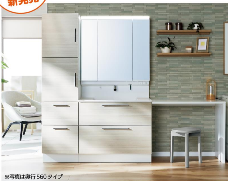
※写真は奥行560タイプ

新しい日常の暮らしに寄り添った洗面ドレッサーが誕生しました。モノをたっぷりしまえる奥行560タイプとコンパクトなサイズの奥行500タイプがあります。