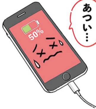
バッテリーのダメージに気を付けて、スマホを長持ちさせたいですね。