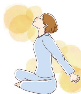
イラスト②ストレッチは一つの動きにつき、10〜15秒程度が目安。無理のない範囲で行いましょう。

起きてからのストレッチは、仰向けになり、手を組んで上にあげ、手足を伸ばしてキープし、その後に脱力。3〜5回繰り返しましょう。あぐらをかくか、椅子やベッドに座つ