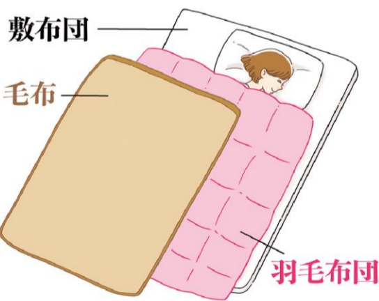
羽毛布団と毛布を使うときは、毛布を上にした方が羽毛布団の保温機能を十分に活かせます。

また、胃腸を動かすことで自然なお通じを促したり、自立神経の動きを良くするといった効果も期待できます。