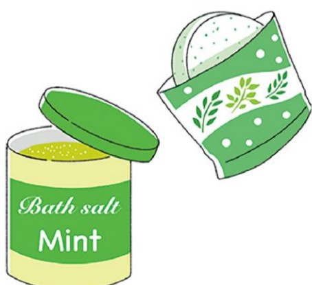
清涼感のある夏向けの入浴剤が豊富にあるのでチェックしてみてください

や、冷凍庫で冷やして使うひんやり枕、首に巻いてひんやりするタオルも節電しながら暑さ対策にもなります。保冷剤をガーゼやハンカチに巻いて首や頭を冷やすのも良いですよ。ちなみに、保冷剤を扇風機に設置して涼しさをアップできるアイテムもあるので要チェックですね。入浴時にメント系の入浴剤を使うとスーッと気持ち持ちが良いです。ハッカ油を浴槽に3〜5滴入れるのもおすすめです。