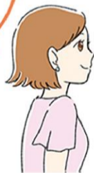
美術館や映画館で涼みながら芸術に触れるのも良いですね！

や、冷凍庫で冷やして使うひんやり枕、首に巻いてひんやりするタオルも節電しながら暑さ対策にもなります。保冷剤をガーゼやハンカチに巻いて首や頭を冷やすのも良いですよ。ちなみに、保冷剤を扇風機に設置して涼しさをアップできるアイテムもあるので要チェックですね。入浴時にメント系の入浴剤を使うとスーッと気持ち持ちが良いです。ハッカ油を浴槽に3〜5滴入れるのもおすすめです。